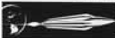
No novo sistema, o motor é movido por um sistema de pás.